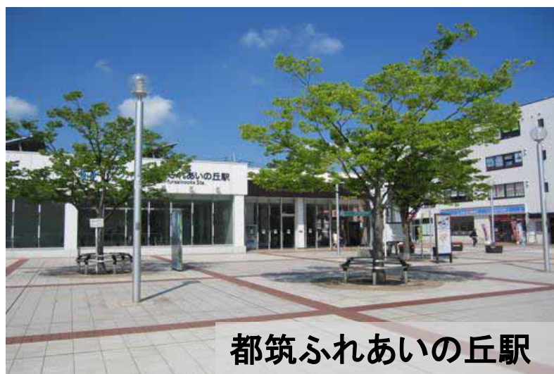
都筑ふれあいの丘駅