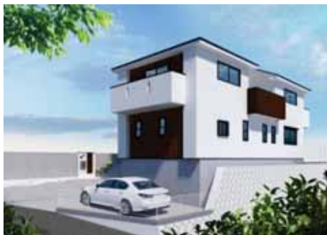
(完成予想図) 存在感ある邸宅