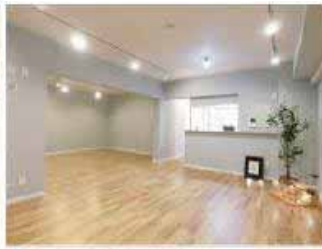
●リビングダイニング